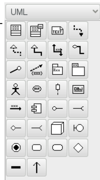
DIA-Elemente für UML

def BewegeHorizontal (self, weite) : # returns pass