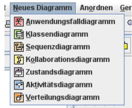
Diagrammtypen bei ArgoUML

Deswegen soll hier noch einmal darauf hingewiesen werden, dass die UML viele weitere Diagrammtypen kennt. So kann beispielsweise mit Sequenzdiagrammen 2 gut der Austausch von Botschaften [messages] zwischen den beteiligten Objekten und die zeitliche und logische Reihenfolge von Abläufen modelliert werden. Der Hamburger Rahmenplan fordert aber deren Behandlung nicht und das Raumplaner-Projekt ist so angelegt, dass es vor allem auf die im Klassendiagramm dargestellten Beziehungen ankommt.